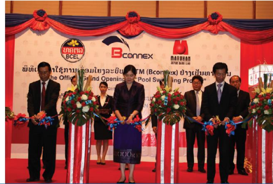
ພິທີເປີດການນຳໃຊ້ການເຊື່ອມໂຍງລະບົບ ATM (Bconnex) ລະຫວ່າງ BCEL ແລະ ທະນາຄານ Maruhan Japan Bank