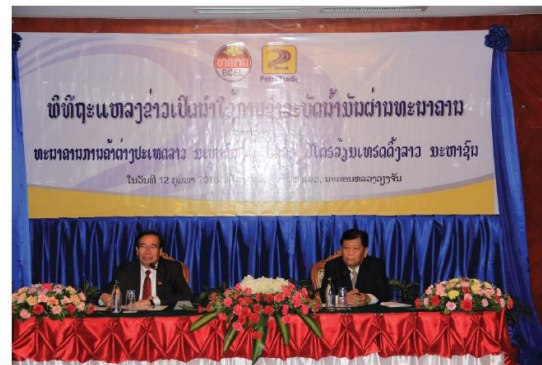
ພິທີຖະແຫຼງຂ່າວເປີດນຳໃຊ້ການຊຳລະບັດນ້ຳມັນຜ່ານ ທຄຕລ