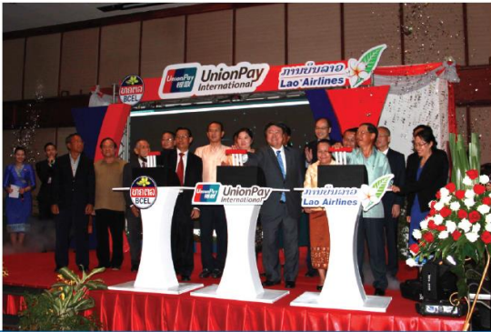
ພິທີເປີດການນຳໃຊ້ຜະລິດຕະພັນ BCEL Co-Brand (ທຄຕລ, ການບິນລາວ ແລະ Union Pay).