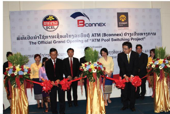
ພິທີເປີດການນຳໃຊ້ການເຊື່ອມໂຍງລະບົບ ATM (Bconnex) ລະຫວ່າງ BCEL ແລະ ທະນາຄານກຽສີອະຍຸດທະຍາ