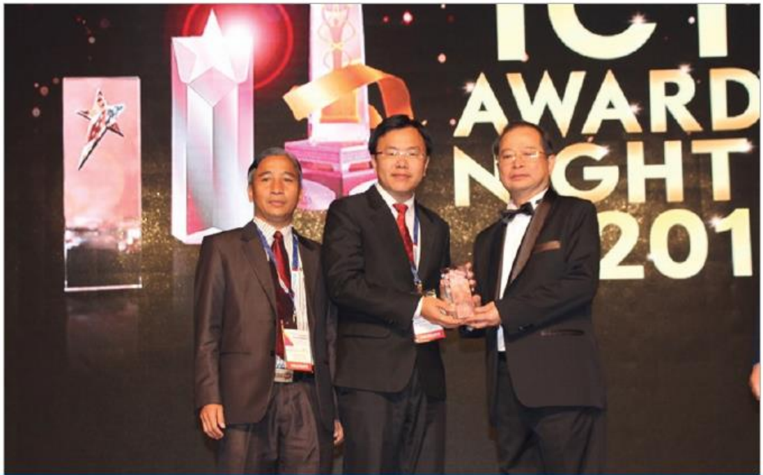
ລາງວັນ ICT AWARDS 2015 ຂອງອົງກອນ ASOCIO ຮ່ວມກັບ PKOM ສະມາຄົມ ICT ຂອງປະເທດມາເລເຊຍ