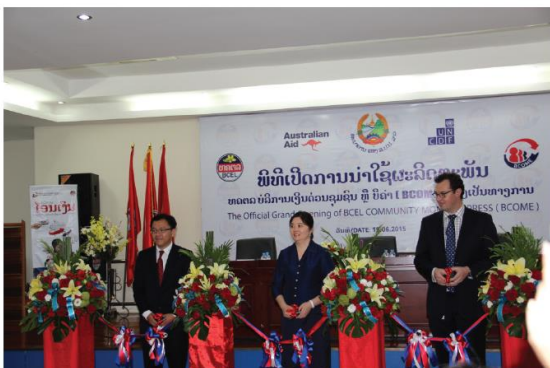
ພິທີເປີດການນຳໃຊ້ຜະລິດຕະພັນ ທຄຕລ ບໍລິການເງິນດ່ວນຊຸມຊົນ (BCOME)