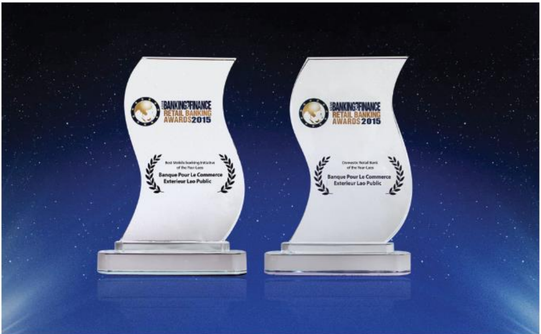
ລາງວັນ Asian Banking & Finance ປະຈຳປີ 2015 ທີ່ປະເທດສິງກະໂປ