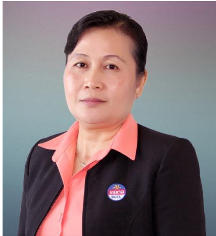
ທ່ານ ນ. ຂັນທະລີ ວົງໄຊຍະລາດ ເປັນ ກຳມະການ