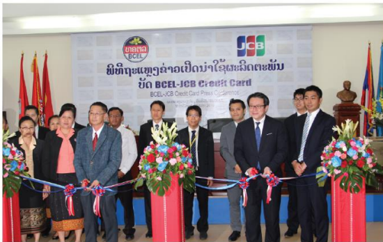
ພິທີຖະແຫຼງຂ່າວເປີດນຳໃຊ້ຜະລິດຕະພັນ ບັດ BCEL-JCB Credit Card